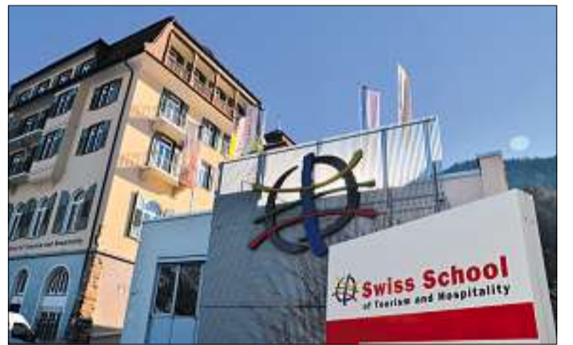
Neu aufgestellt: Nach dem Aktienrückkauf steht das Schulhotel in Passugg wieder auf einem soliden Fundament.